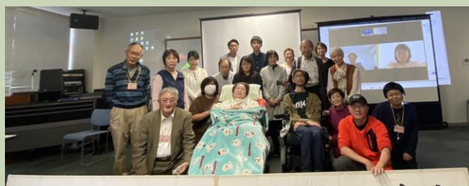
日本ALS協会愛媛県支部

令和になり、『ケアの社会化』がとりあげられるようになり、家族任せにしないことが大切だ」と述べました。